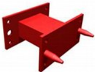
Sprednja pritrdilna plošča na traktor